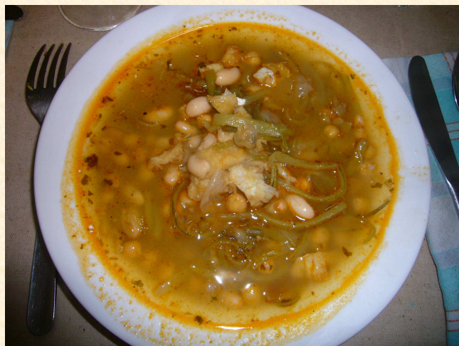
FIGURA 3. Los potajes de cuaresma con cardillos han sido muy populares en la gastronomía rural. El cardillo ( Scolymus hispanicus ) aún se recolecta en la Sierra de Ávila y se consume tradicionalmente en tortilla, revuelto, cocidos y potajes.

Se ha registrado la recolección y consumo de 24 especies, 22 corresponden a plantas vasculares y 2 a hongos. La información procede de las encuestas realizadas a población procedente de 9 pueblos de la sierra de Ávila: Cabezas del Villar, Casasola, Chamartín, Cillán, Duruelo, Gamonal, San Juan del Olmo, Gallegos de Sobrinos y Mirueña.